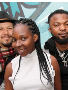
Vue Belle