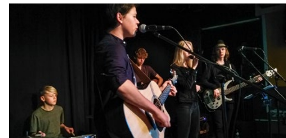
The Acoustic Corner Allstars.

The Acoustic Corner All Stars – musikalischer Ausklang mit Tanz (Bühne)