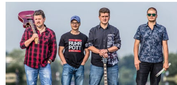
LIFE ON WHEELS.

LIFE ON WHEELS – Münchner Band, rockiger Sound kombiniert mit echtem Balkan-Groove (Kleiner Konzertsaal)